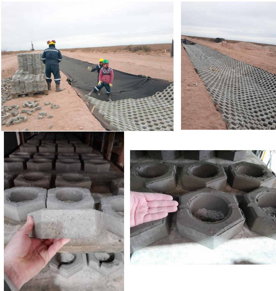
Figura 1: Ejemplo de colocación de adoquines sueltos y fotos del elemento a la salida de la prensa de origen nacional ubicada en el predio industrial de la ciudad de Neuquén (socio Activo AABH).

Este Sistema permite obtener un revestimiento de bloques de hormigón resistente, flexible, permeable, liso y estable frente a la acción de la corriente de agua de lluvia. El objetivo del sistema es materializar un revestimiento de protección a la erosión del suelo, de alta resistencia, alta durabilidad y bajo costos de mantenimiento.